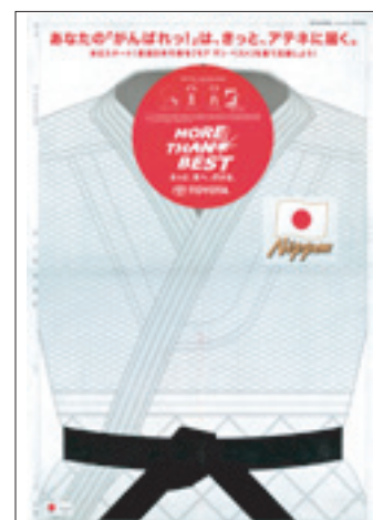
2004年度 グランプリ作品 トヨタ自動車 モア ザン ベスト

ブルー日刊アド・グランプリは、日刊スポーツが始めた「青空広告」の優秀作品を選ぶことを目的に1988年にスタートしました。第3回からカラー広告部門、第8回から各本社賞などが加わりました。第18回となった2004年度はトヨタ自動車のカラー2連版広告がグランプリに輝きました。